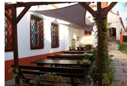
Terrasse vor dem Klosterstübel

Ab sofort kann unser Klosterstübel verpachtet werden. Kapazitäten: Klosterstübel ca. 30 Plätze Kleines Stübel ca. 20 Plätze Klosterkeller ca. 50 Plätze Terrasse ca. 25 Plätze Roter Saal ca. 100 Plätze (Anmeldung über die Klosterinformation)